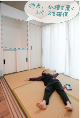
将来、仏壇を置くスペースを確保

「豊スペースは絶対に欲しかったんです！」と話してくれた和室は、リビングと段差をつけずフラットにすることで広々とした空間になっています。豊スペースには、五月人形の大きさに合わせた収納と、その上には仏壇も置けるように広めのスペースを確保した設計になっています。リビングとの間の引戸を開けると和室が1部屋になり来客時にも対応できます。「子どもが風邪を引いたときにもキッチンから目が届くので安心です。」と奥様。ゆったりごろんとできる和室で家族みんなでお昼寝することもあるそうです。