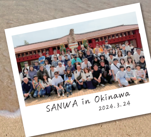
SANWA in Okinawa 2024.3.24